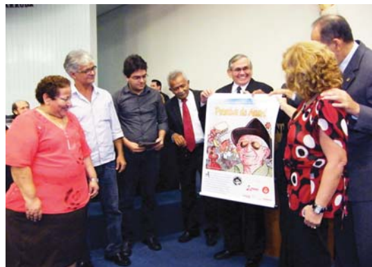
Homenagem ao centenário de Patativa do Assaré

data do aniversário de Patativa. Ainda na sessão foi lançado o cordel “Centenário de Patativa do Assaré: os mandatos comunistas e a cultura popular”, de autoria dos vates Arievaldo Viana e Jô Oliveira. A publicação marca a atuação dos mandatos comunistas junto aos segmentos da cultura de Fortaleza, do Ceará e do Brasil e seu respeito à obra e a vida do mestre de Assaré.